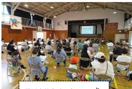
横浜市教育委員会 HP より