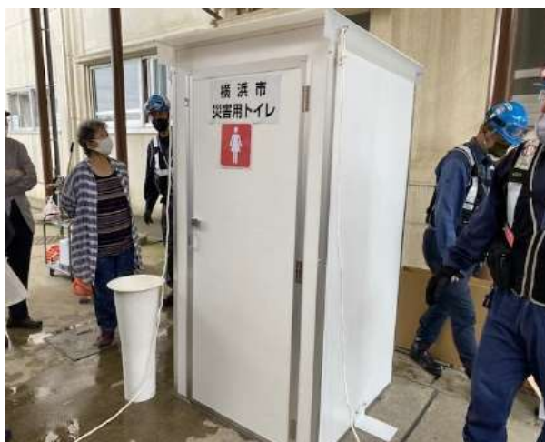
← ハマッコトイレ完成図 (この中に右上のトイレが収納される)

災害が発生した時には、住民と自治会が一体になって協力しながら『ハマッコトイレ』を設置し、運営していくことが求められています。