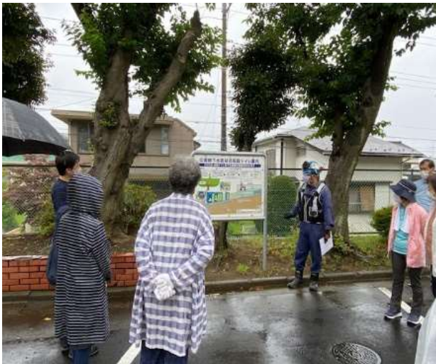
← トイレが設置される場所 (体育館前空き地。マンホール上にトイレを設置)

大地震等で緊急避難所(日限山小学校)が開設されたときに問題になるのがトイレです。 令和2年度の横浜市の整備計画で、新しいトイレ『ハマッコトイレ』が日限山小学校にも整備されました。 日限山小学校地域防災拠点での初めての設置訓練が、6月19日(土)に小雨の降る中、日限山小学校体育館前で実施されました。