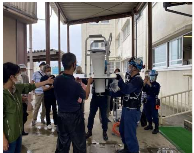
↑ トイレの便座を組み立てたところ